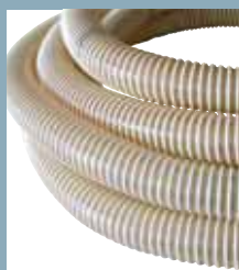
Tubo antistatico Tuyau antistatique